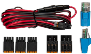
Zubehör im Lieferumfang des Cerbo GX