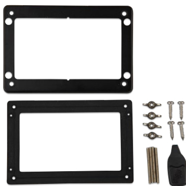
Zubehör im Lieferumfang des GX Touch 50